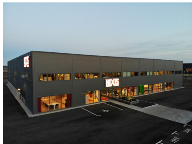
HEXIS | Landskrona (Schweden)

Diesbezüglich verfügt HEXIS über ein umfassendes Markt- und Branchen-Know-how speziell im Bereich Schienenfahrzeuge und Rollmaterial (Züge, Straßenbahnen, Busse).